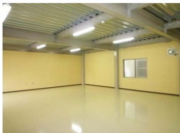
▲ 1階 倉庫