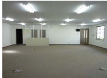
▲ 2階 事務室