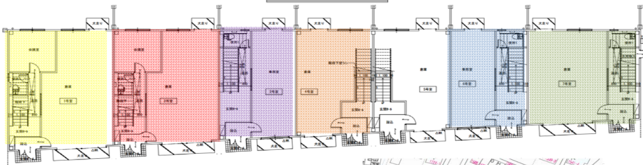
駐車場敷地内 前面配置